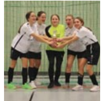
Text/Bilder: Pfarreiengemeinschaft Ehekirchen

Durch diese Siege waren beide Mannschaften auch für den Bistumscup aller Ministranten der Diözese Augsburg qualifiziert. Personell geschwächt durch die am selben Wochenende stattfindende Rosenaktion machte sich eine Mannschaft auf den Weg, um Ehekirchen im Allgäu zu vertreten. Die dortigen Ministranten organisierten im Pfarrheim in Heimenkirch eine Übernachtungsmöglichkeit und hießen die Ehekirchner herzlich willkommen. Etwas geschwächt von einer Nacht auf Isomatten und mit nur einer Ersatzspielerin kämpfte die Ehekirchner Minis tapfer und konnten einen guten 6. Platz erzielen.