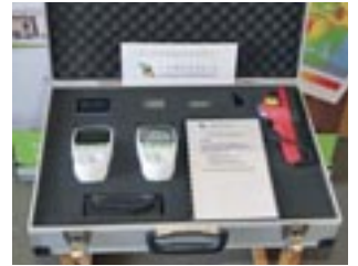
Den Energiesparkoffer des Landkreises Neuburg-Schrobenhausen können sich ab sofort Bürgerinnen und Bürger ausleihen.