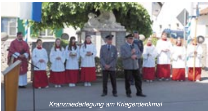
Kranzniederlegung am Kriegerdenkmal