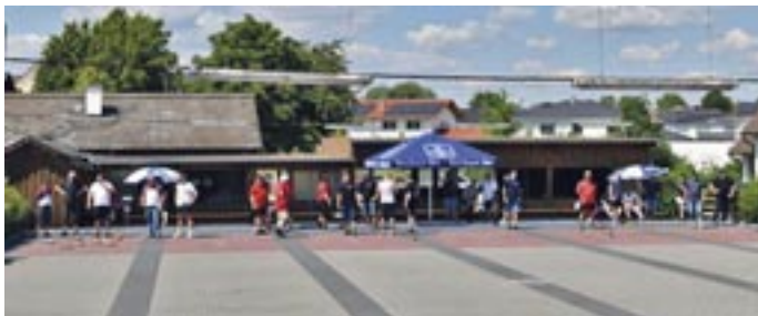
Sportanlage mit Vereinsheim beim Hobbyturnier 2023.