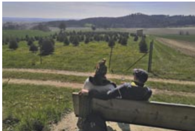
Ausblick auf Ehekirchen und Lorenziberg von der Rastbank auf der südl. Streichholzrunde.