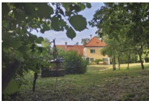
Ehemaliges Schäfer- und Forsthaus auf dem Gumpenberg. In diesem Garten besteht am betreffenden Septemberwochenende eine der Rastmöglichkeiten.

Infos zu den Wanderwegen finden sich im Wanderwegeflyer der Gemeinde. Dieser liegt im Rathaus aus bzw. ist auf der Homepage der Gemeinde einsehbar. Text/Bilder: Utz/Grabler