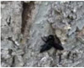
Blauschwarze Große Holzbiene.