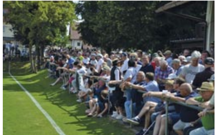
Rekordkulisse für den FC Ehekirchen