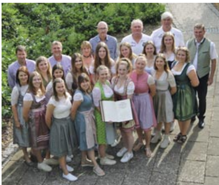
Die erfolgreiche Fußball-Damen-Mannschaft der SG Ehekirchen/Bayerdilling mit Trainern, Abteilungsleitern und 1. Bürgermeister Günter Gamisch.

Aufstieg in die Bezirksliga wird mit dem Eintrag ins Goldene Buch gekrönt